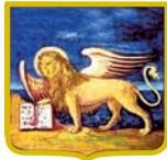
PATROCINIO REGIONE DEL VENETO